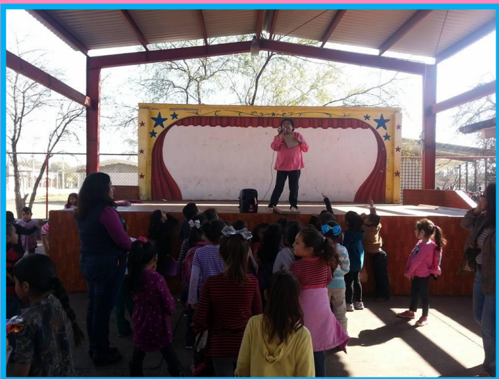
LOS ALUMNOS PARTICIPAN EN JUEGOS ORALES.