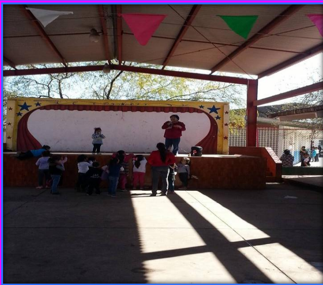
JUEGO DE ADIVINANZAS