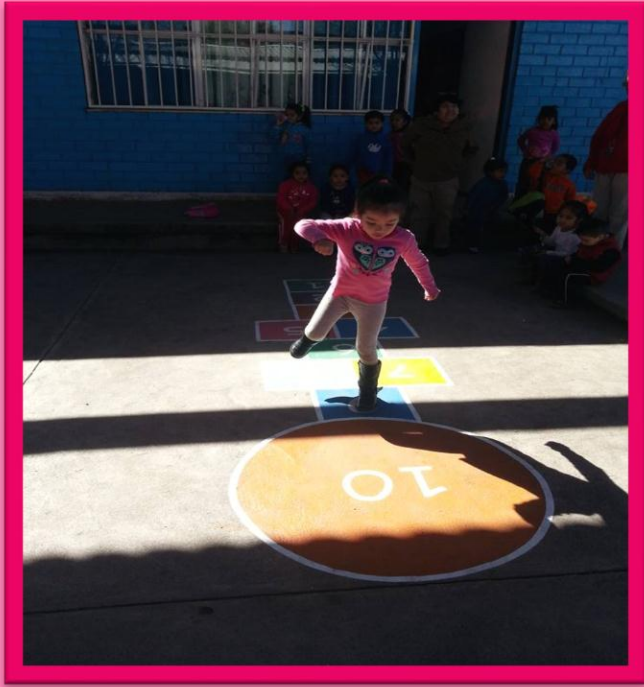
BEBELECHE TRADICIONAL CON NUMEROS