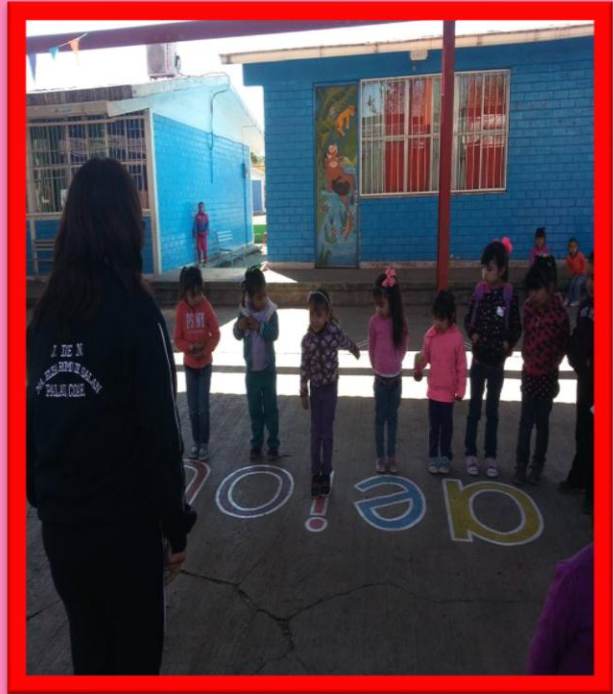
JUEGO CON LAS VOCALES