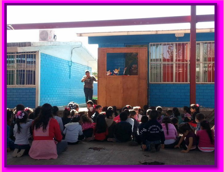
ESCUCHAN LA NARRACION DE CUENTOS MEDIANTE GUIÑOLES.