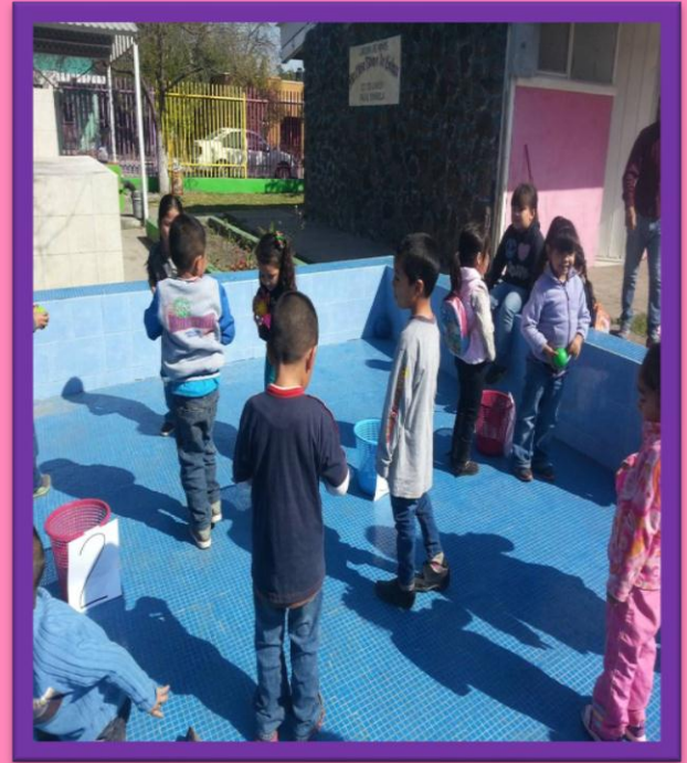
LANZA PELOTAS SEGÚN EL NUMERO