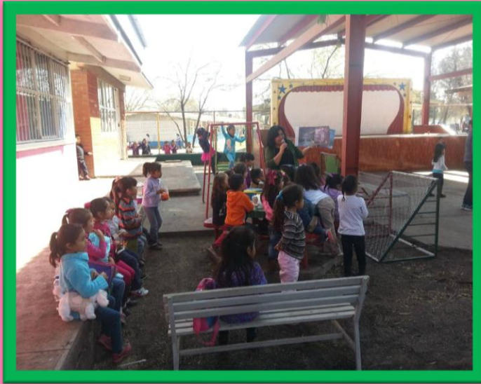
LECTURA DE CUENTOS