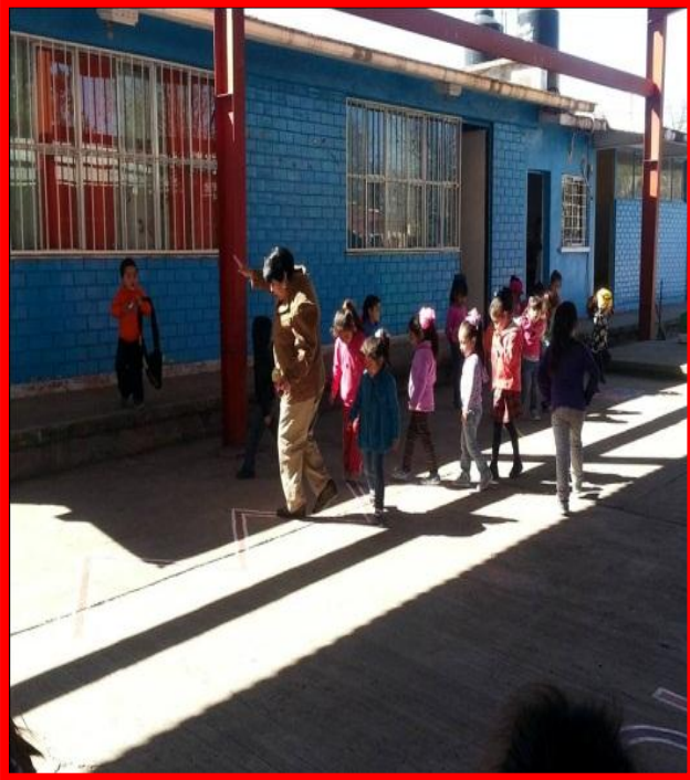
CAMINA SOBRE DIFERENTES LINEAS Y FIGURAS GEOMETRICAS