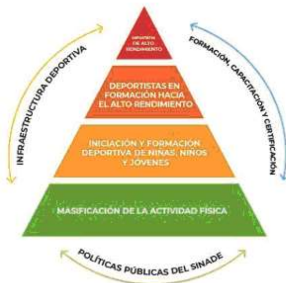
Figura 1. Estructura piramidal del desarrollo de la cultura física y el deporte

La construcción de una cultura física sólida y en constante desarrollo y un deporte de calidad, desde los ámbitos de promoción hasta los altos niveles competitivos, requieren del esfuerzo permanente del gobierno federal, de las entidades federativas, de los ayuntamientos, de las asociaciones deportivas nacionales (ADN), de las instituciones académicas de los tres niveles educativos y, en general, de los distintos sectores de la sociedad mexicana.