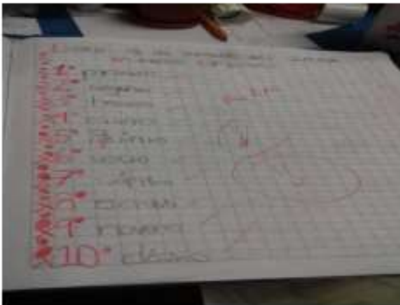
Escribimos los números ordinales

En su libreta hace diferentes ejercicios como escribir con número y letra los números ordinales y enumeran una serie de competidores del primero al décimo en orden.