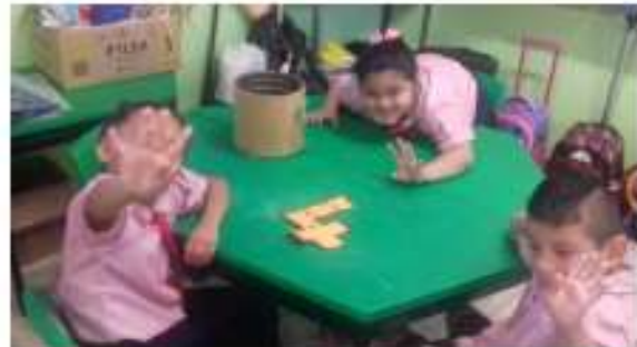
Armando el rompecabezas

En su libreta hace diferentes ejercicios como escribir con número y letra los números ordinales y enumeran una serie de competidores del primero al décimo en orden.