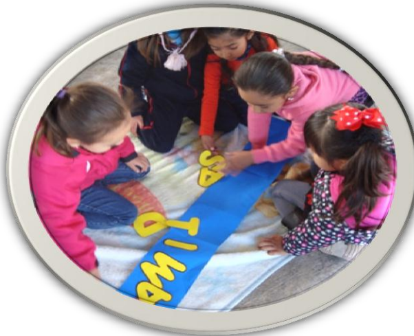
PALABRAS DE LA AMISTAD Y EXPRESION DE SIGNIFICADOS