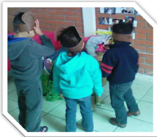
DRAMATIZACION DE CUENTOS CON VALORES