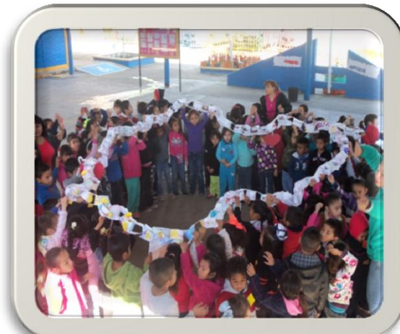
UNIÓN DE LA CADENA DE LA AMISTAD DE TODO EL JARDÍN