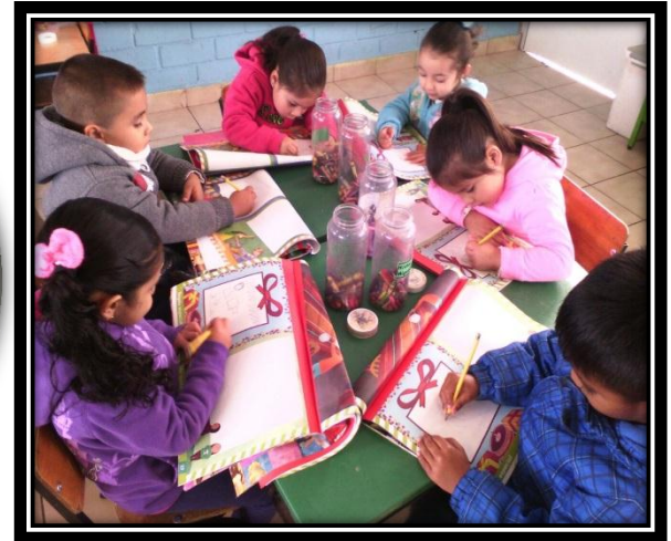
UN REGALO ESPECIAL LIBRO DE MIÁLBUM